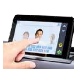
Choix des profils utilisateur sur le SD One MF et numérisation directe vers les destinations prédéfinies uniques de chaque utilisateur.