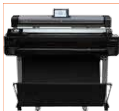
Support haut en option pour positionnement sur l'imprimante.