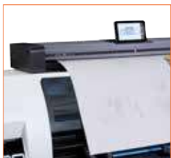
SD One MF est assez léger pour être placé sur n'importe quelle surface plane ou positionné sur un support bas en option.

Idéal dans les situations dans lesquelles vous devez allouer les coûts, SD One MF est doté d'un logiciel de gestion d'impression qui vous permet de suivre le coût de chaque numérisation, copie ou impression.