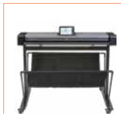
Support bas pour positionnement côte à côte.